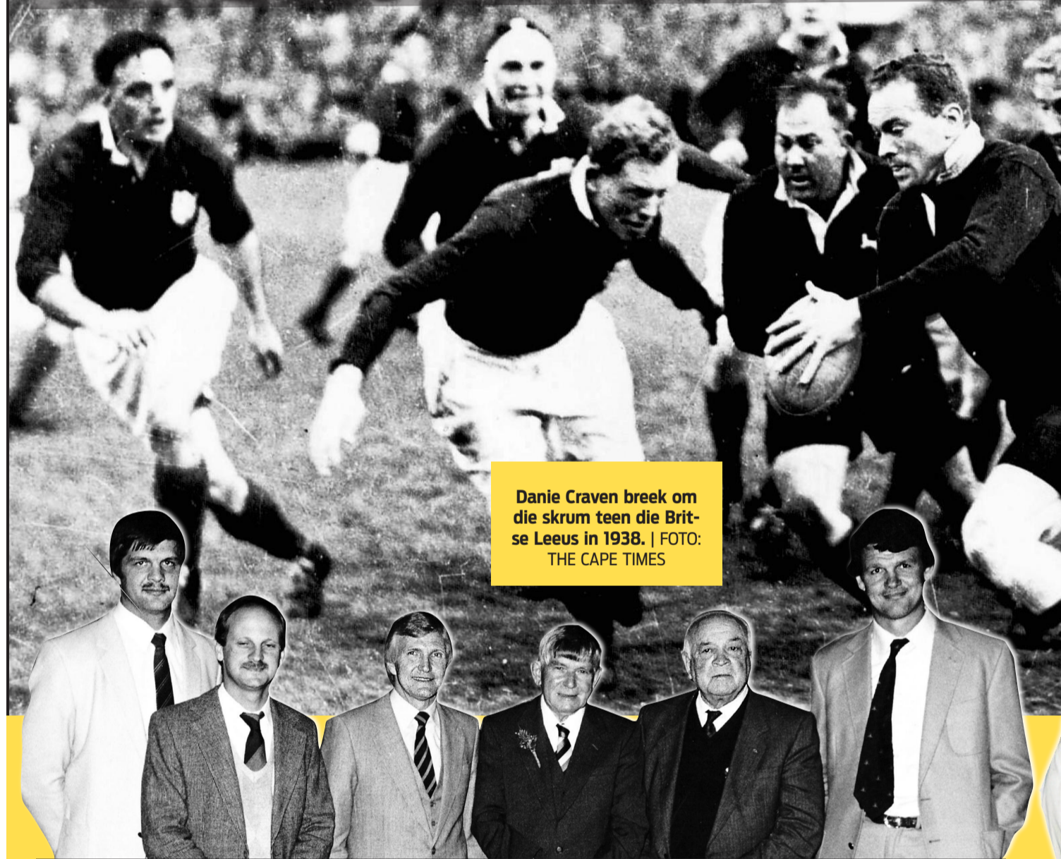
Danie Craven breek om die skrum teen die Britse Leeus in 1938.